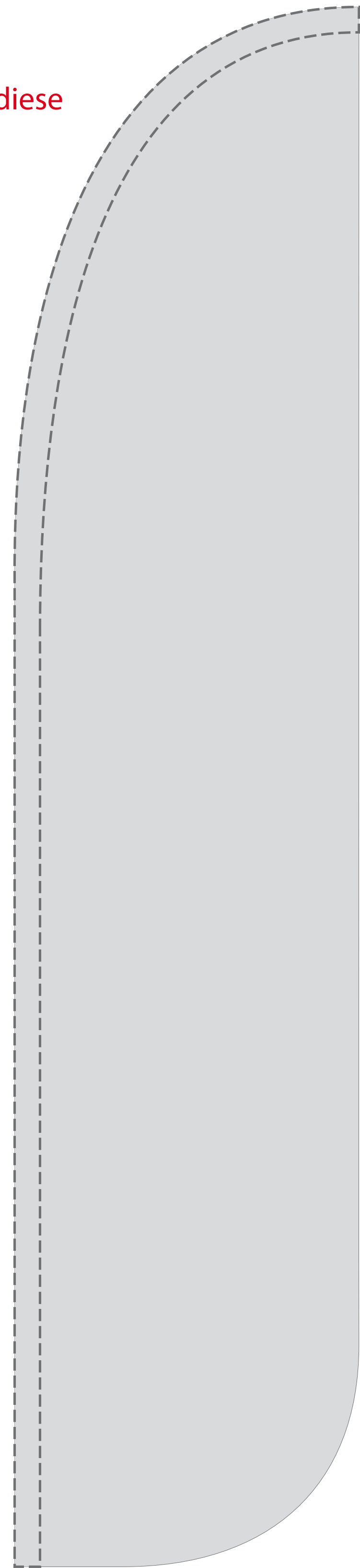
Beachflag Shark 500 Fahnenformat 95 x 430 cm Gesamthöhe ca. 500 cm